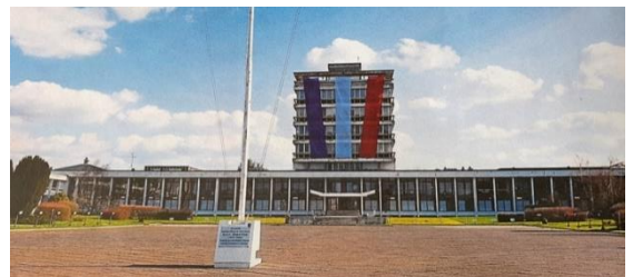
Ecoles Militaires de Bourges