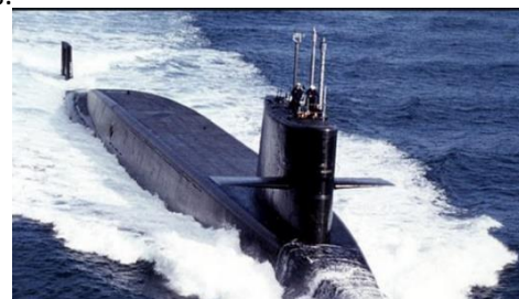
SNLE Le Triomphant

La loi de programmation militaire prévoit que ces nouveaux sous-marins remplaceront les actuels SNLE (du type triomphant) dès leur retrait du service à compter de 2035 à raison d'une unité tous les 5 ans afin d'assurer la continuité de la dissuasion de notre force océanique stratégique qui doit maintenir en permanence au moins un sous-marin de l'espèce en patrouille. Ces futurs sous-marins de troisième génération (SNLE 3G) présenteront une discrétion acoustique améliorée.