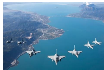
Rafale en vol