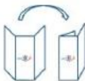
Mode de pliage