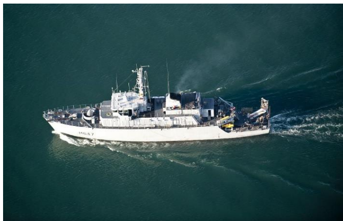
Chasseur de mines CÉPHÉE

Qui : C'est une classe de 3e avec ses élèves, ses enseignants + 1 conseiller principal d'éducation. Dans le projet il est également prévu un embarquement et une navigation des élèves à bord du CEPHEE, afin de resserrer les liens entre les élèves et la Défense. Cette ouverture sur des possibilités d'avenir professionnel est une expérience profitable à la nation et de nature à renforcer l'unité du pays dans ses fonctions régaliennes.