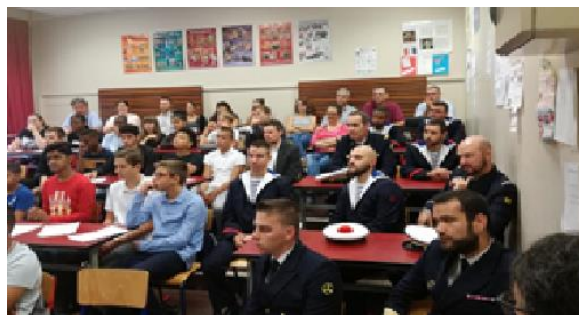
Marins et collégiens ensemble à l'écoute, CSGDG du collège

Jean Jaurès de Poissy, toujours d'actualité