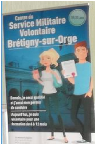
Affiche du 2 RSMV