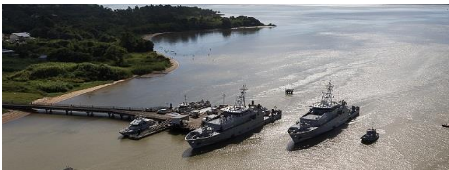
Base navale de Dégrad des Cannes

Inaugurée en 1994, la base navale de Dégrad des Cannes a pour principales missions le soutien technique, logistique des unités qui y sont stationnées :