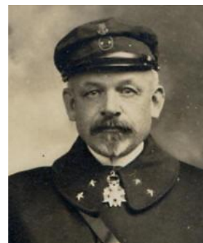
contre-amiral Alexis Ronarc'h

La ministre des armées a officiellement lancé la série des 5 FDI, Frégates de Défense et d'Intervention, par la cérémonie de découpe de la première tôle. La première FDI portera le nom du contre-amiral Ronarc'h en souvenir de ce très grand amiral qui, avant de devenir chef d'état-major de la Marine, s'est illustré pendant la première guerre mondiale à la tête des fusiliers marins et des marins de tous les ports venus arrêter l'ennemi à Dixmude. Les FDI suivantes porteront les noms d'amiraux : Louzeau, pionnier de la Force Océanique Stratégique qui vient de nous quitter et dont nous honorons ainsi la mémoire, puis Castex, Nomy et Cabanier.