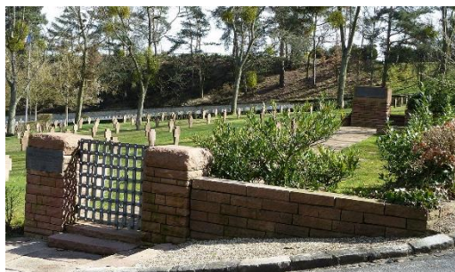
Versailles, le cimetière de Gonards – Carré allemand

Parmi les journées de commémoration dans les Yvelines, une n'est pas nationale : le jour du deuil allemand, célébré le premier dimanche après le 11 novembre.