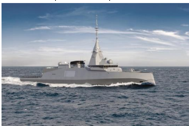
Projet de frégate de Taille Intermédiaire (servant de base à l'étude des FDI)

Ce bâtiment innovant suscite déjà l'intérêt de plusieurs nations, notamment la Marine grecque, avec laquelle nous avons signé le 10 octobre une lettre d'intention visant à préparer l'acquisition par la Grèce de deux frégates FDI. Cette acquisition est la promesse d'une interopérabilité accentuée entre nos deux marines.