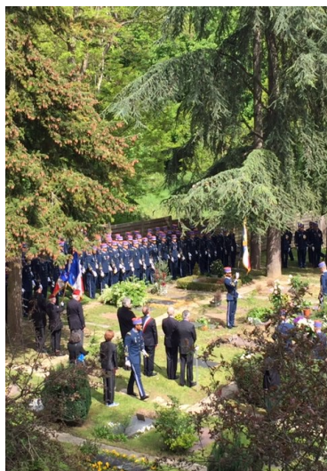
Le 7 mai 2019 à Louveciennes Hommage de la 57e promotion de l'EMIA Au général Le Boudec

La cérémonie du 7 mai en présence de la famille du général Le Boudec a permis de revenir sur la carrière de cet homme exceptionnel qui avait commencé comme résistant dans le maquis de Bretagne en 1944 pour la terminer à Versailles avec le grade de général, 40 ans plus tard. On retiendra qu'il a participé à toutes les campagnes et opérations possibles, entre autres l'Indochine, l'Algérie, Suez ou Madagascar. Il avait tenu des commandements opérationnels dans quatre unités de parachutistes prestigieuses. On retiendra son service au sein du célèbre 6ème bataillon de parachutistes coloniaux aux ordres du général Marcel Bigeard où il est 5 fois blessé, à la tête de la compagnie de parachutistes indochinois, au sein du 3ème régiment de parachutistes coloniaux devenu d'infanterie de marine par la suite et encore à la tête du 2ème régiment de parachutistes d'infanterie de marine à Madagascar. Les élèves officiers dans leur splendide uniforme de tradition ont lu un hommage, chanté leur chant de promotion à la mémoire de leur parrain et ont chacun déposé une rose blanche sur sa tombe