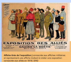
Affiche tirée de l'exposition consacrée aux affiches militaires et représentant une affiche invitante à visiter une exposition consacrée aux alliés en 1916 | SHD