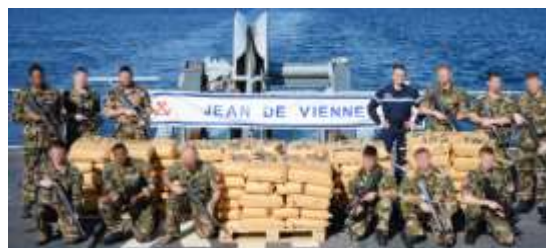
La drogue saisie au cours des deux opérations