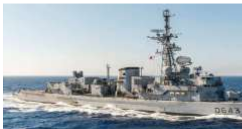
Le Jean de Vienne