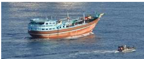
Le boutre interpellé avec un zodiac de commandos

Le circuit d'acheminement des drogues transite par plusieurs voies avant d'arriver en Europe et en France : le parcours terrestre se fait historiquement par la Route de la Soie avec ses pays environnants et zones maritimes proches, parfois producteurs de drogue, ainsi que par l'autre voie qu'est l'Atlantique. Les voies aériennes étant moins importantes pour la quantité. Le débarquement des drogues se fait le long des côtes qui vont du nord-ouest de l'Afrique jusqu'aux côtes françaises, notamment le Golfe de Gascogne.