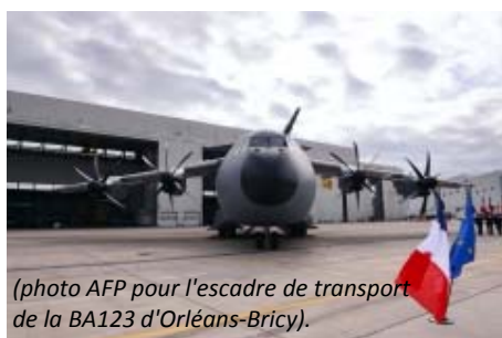
(pour l'escadre de transport de la BA123 d'Orléans-Bricy).

Elle va créer sept nouvelles escadres aériennes (4 ont déjà été créées en 2014 à Avord(2), Istres et Nancy), niveau supérieur à l'escadron qui correspond peu ou prou à un régiment pour l'armée de terre. Ces escadres vont voir le jour sur les bases aériennes d'Evreux, Saint-Dizier, Luxeuil, Mont-de-Marsan, Cazaux et Orléans. Cette évolution s'inscrit dans le plan Unis pour faire face. Il s'agit de rendre plus cohérente l'organisation de l'armée de l'air.