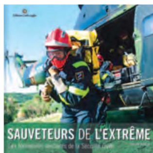
De Fredd VERDY, éditions Carlo Zaglia, 220 p., 36 €

L'auteur revient, sans détour, sur les débuts de la guerre en Afghanistan, l'engagement de l'armée française, mais aussi et surtout sur le récit du massacre de Gwan. La seconde partie du livre est un recueil de témoignages, de militaires, de compagnes de rescapés, d'un psychiatre.