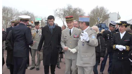
Visite des stands par le GCA Charpentier

Au contact des cadres de réserve des trois armées et du service de santé, mais aussi de la gendarmerie, des pompiers, du service national et de jeunes cadres de l'industrie, réservistes citoyens ou opérationnels de surcroît, au sein des institutions militaires et de l'état, ce fut l'occasion pour ces jeunes de découvrir tout au long de cette journée, l'ensemble des aspects méconnus de la citoyenneté et d'entrevoir leur implication possible au sein de la réserve tout en ayant une activité professionnelle.