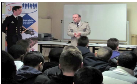
Lycée professionnel J. Moulin du Chesnay

1- plusieurs conférences, animées par des cadres de réserve des trois armées et la gendarmerie, ont été menées le jeudi 05/04/13. Avec l'aide de la Direction des Services Départementaux de l'Éducation Nationale des Yvelines (DSDEN – ex Inspection académique), 250 jeunes, élèves de lycées technologiques et professionnels du département ont participé à ces conférences,