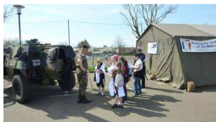
Jeunes écoliers devant un VBL écoutant les explication du réserviste

3 - une participation au City-Raid de Montigny – le – Bretonneux, où 250 collégiens ont découvert deux engins blindés et les nombreuses possibilités qu'offrait la réserve citoyenne et opérationnelle.