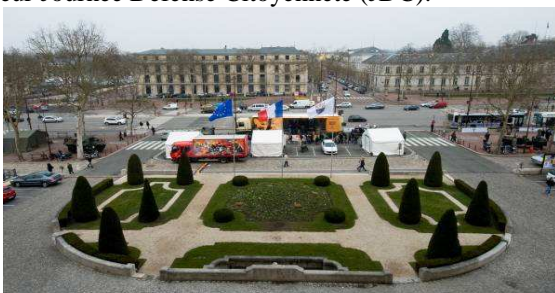
Place de la mairie de Versailles

2 - une grande manifestation avenue de Paris à Versailles toute la journée du vendredi 05/04/13 autour de stands installés de part et d'autre de l'avenue où de nombreux acteurs ont présenté une douzaine de stands (militaires, services de l'état, industriels) au profit de 150 lycéens de Versailles et d'une quarantaine de jeunes effectuant leur Journée Défense Citoyenneté (JDC).