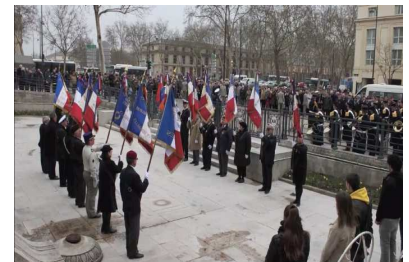
Cérémonie au monument aux Morts

En marge des manifestations extérieures de la JNR, se tenait dans les salons de l'Hôtel de ville, l'exposition "1969-2013, 45 ans d'opérations extérieures des armées françaises" organisée par la ville de Versailles