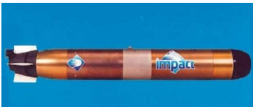
Torpille MU 90

contribuant ainsi à la réduction des déficits de l'Etat, et au maintien de notre souveraineté et de notre statut international.