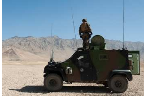
Petit véhicule protégé

Un peu plus de trente milliards d'euros seront consacrés au budget de la défense en 2011, un effort respectueux des grands équilibres.